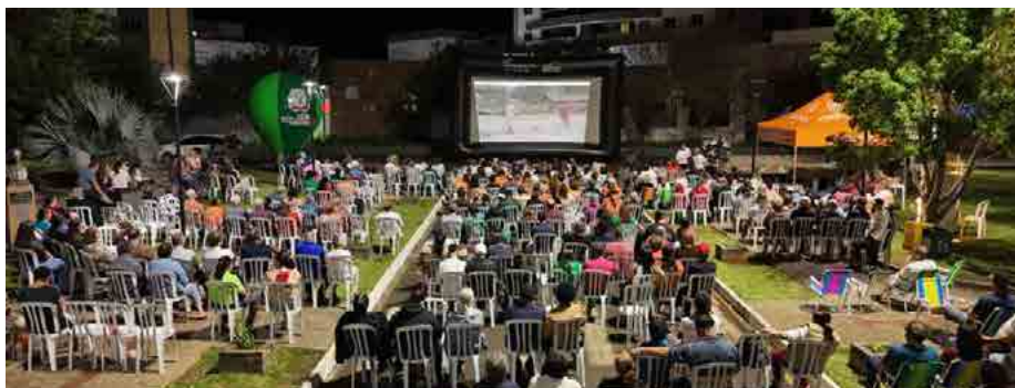
Exibição do filme "Jecão um Fofoqueiro no Céu" em Coronel Vivida - realização Sesc Pato Branco

"O Sesc Paraná tem um sério compromisso com a salvaguarda do cinema nacional e com a promoção e manutenção de figuras emblemáticas do audiovisual brasileiro, como Amácio Mazzaropi. Desde 2023, realizamos uma série de ações em parceria com o Instituto e Museu Mazzaropi, incluindo a exibição, em nossas Unidades de Serviço, de filmes do acervo da instituição, licenciados pelo Sesc PR. A chegada de Mazzaropi aos diferentes territórios do Paraná tem sido sempre acolhida e celebrada por públicos de diversas faixas etárias. Já estivemos em mais de 130