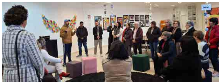
Abertura da Exposição "Mazzaropi" no Sesc Pato Branco

O Cinema ao Ar Livre é um projeto do Sesc PR que está próximo de completar cinco anos de execução. Seu objetivo é atender diferentes territórios paranaenses por meio da exibição de filmes com qualidade artística e narrativa para toda a família, descentralizando e ampliando o acesso ao cinema em todo o estado. Ao longo desse período, mais de 35 mil pessoas já participaram das atividades promovidas pelo projeto.