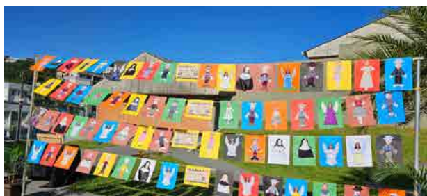
Exibição de cinema e exposição artística no Sesc Francisco Beltrão