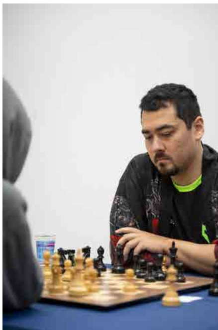
Fier - Campeão Rápido

Nos torneios de Blitz e Rápido também foram premiados atletas de diversas categorias, nos naipes feminino e masculino, incluindo Sub-8 ao Sub-18, Melhor Juvenil, Sênior, Melhor do Litoral, Melhor Não Ranqueado,