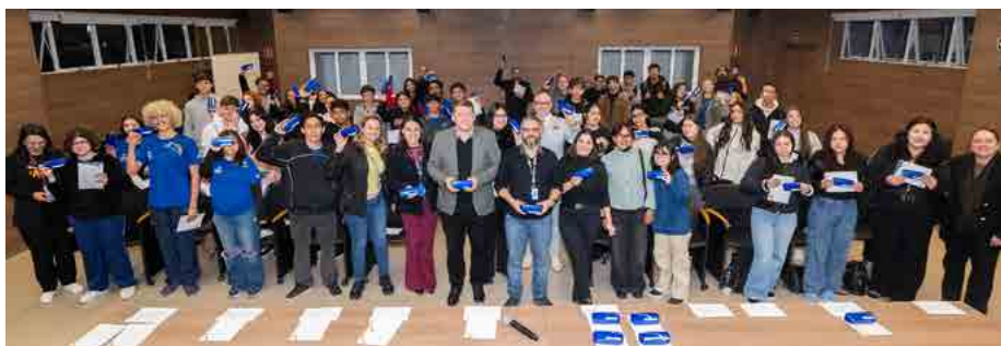
Alunos do Curso Técnico em Óptica, aprendizes e representantes do Senac PR durante a entrega dos óculos produzidos na ação socioeducativa realizada pela Faculdade Senac Curitiba Portão