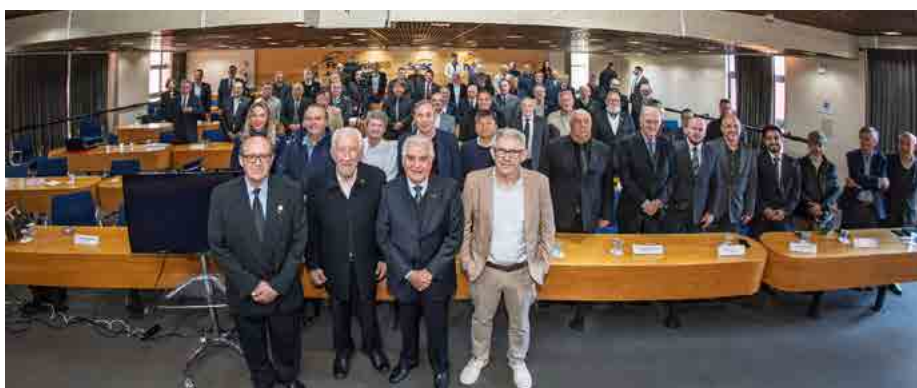
Diretoria empossada para o quadriênio 2026/2030