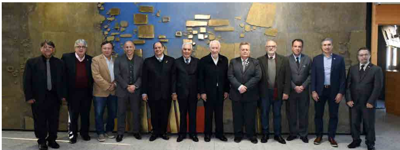
Presidente e vice-presidentes da Fecomércio PR

Aconteceu na sexta-feira (12) a cerimônia de posse da nova diretoria da Federação do Comércio de Bens, Serviços e Turismo do Paraná (Fecomércio PR), para o quadriênio 2026/2030.