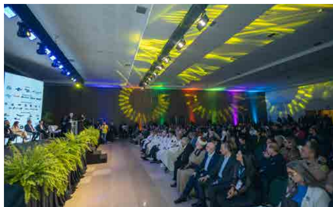
Autoridades e lideranças do turismo nacional participaram da solenidade, em Foz do Iguaçu

Foz do Iguaçu, segundo destino brasileiro mais visitado pelos turistas, recebe de 10 a 12 de junho a 21ª edição do Festival Internacional das Cataratas (FIT Cataratas).