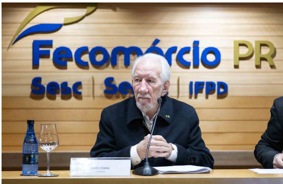
O presidente do Sistema Fecomércio Sesc Senac PR e vice-governador do Paraná, Darci Piana, durante a reunião da Diretoria da Fecomércio PR, realizada em 26/05/2026

A nomeação reforça a atuação da Fecomércio PR na pauta internacional. Por meio da Diretoria de Rela-