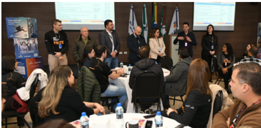
Diretoria do Senac PR participou do encontro