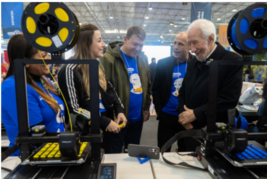
Darci Piana, presidente do Sistema Fecomércio Sesc Senac PR e vice-governador do PR, na abertura da Semana S do Comércio

Fique agora com a cobertura especial da Semana S do Comércio no Boletim Diário e acompanhe as principais ações, experiências, atrações e histórias que movimentaram Curitiba e diversas cidades do Paraná.