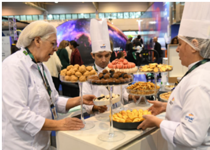
Técnica, criatividade e precisão marcaram as demonstrações da ocupação de Confeitaria na Arena Competições durante a Semana S do Comércio