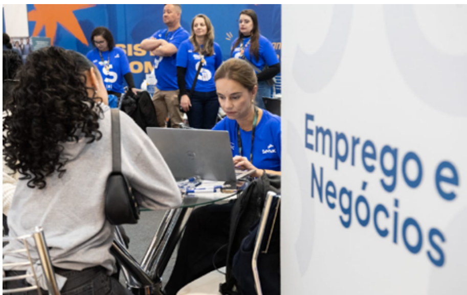
Espaço Emprego e Negócios do Senac PR durante a Semana S do Comércio em Curitiba