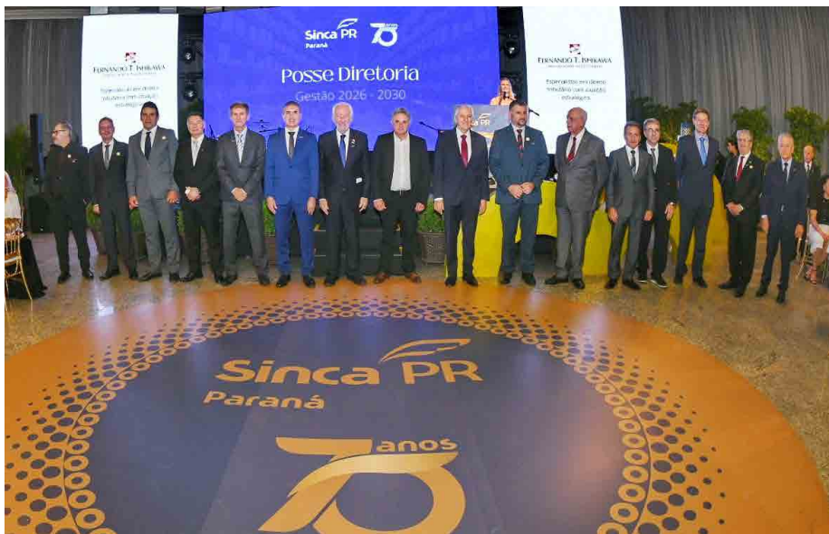
Nova diretoria do Sinca PR para o quadriênio 2026-2030

Segundo ele, os números do setor demonstram sua relevância para a economia paranaense. De acordo com o Ranking Abad 2025, as empresas do segmento no Paraná registraram faturamento superior a R$ 12 bilhões, com crescimento de 16%, resultado acima da média nacional.