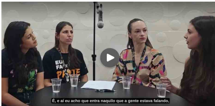
Podcast desenvolvido por aprendizes do Senac Londrina Centro

dos a refletir sobre suas reações ou a ausência delas. O resultado evidenciou um ponto sensível: o receio de “invadir” a privacidade alheia muitas vezes se transforma em omissão.