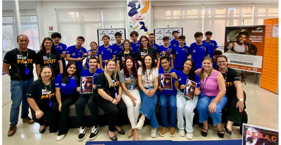
Lançamento da revista elaborada pelos aprendizes da Faculdade Senac Curitiba Portão como parte das ações do Calendário Consciente - Edição Especial Mês da Mulher