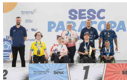
Campeões das categorias masculinas

O futuro da bocha no Brasil passa pelo Campeonato Brasileiro de Jovens de Bocha Paralímpica, finalizado na terça-feira (31) em Curitiba. A competição, realizada em parceria com a Associação Nacional de Desporto para Deficientes (Ande), faz parte do projeto Paracopa Sesc PR, que fomenta o desenvolvimento de diversas modalidades para pessoas com deficiência (PcD), visando a inclusão social, assim como abrir portas para novos talentos no alto rendimento.