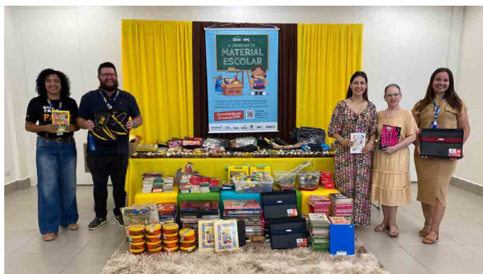
Doação de seis mil itens feitos pela Papelaria Príncipe Encantado, de Nova Londrina