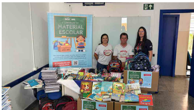
Projeto Boia Fria, de Santo Antônio da Platina, que recebeu 750 itens arrecadados pela campanha

A 8ª edição da Campanha do Material Escolar, promovida pelo Sesc PR em parceria com a RPC, foi encerrada no dia 27 de março com resultados expressivos. Ao todo, foram arrecadados 155.625 itens, dos quais 142.471 já foram distribuídos, beneficiando 34.189 crianças atendidas por 220 instituições sociais em diversas regiões do estado.