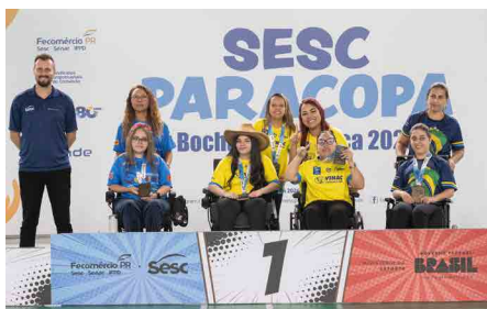
Campeãs das categorias femininas