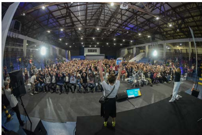
Quase mil ambulantes se reuniram no Ginásio de Esportes do Sesc Caiobá, em Matinhos, para participar do Maré de Oportunidades