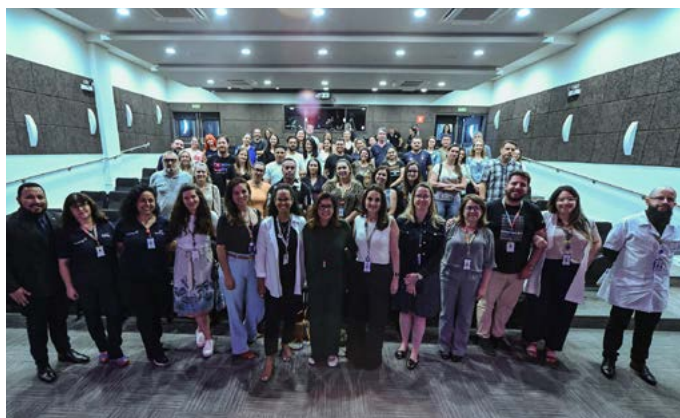
Segunda edição do Família Conectada

Com o tema “Em casa a gente conversa: como se comunicar com adolescentes?”, o Sesc e o Senac PR realizaram a segunda edição do Família Conectada. Voltada a pais, familiares e responsáveis pelos estudantes do Ensino Médio Integrado ao Técnico Sesc Senac PR, a ação foi realizada no dia 22 de novembro, no Auditório do Sesc São José dos Pinhais com transmissão ao vivo para as 11 unidades que oferecem o projeto.