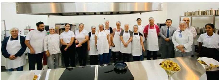
Alunos do Senac prepararam a famosa polenta de Santa Felicidade para a inauguração da Casa Culpi

abrigou a esperança de uma tradicional família italiana da região de Santa Felicidade. O Senac vai, ao lado da Secretaria de Segurança Alimentar, permitir que jovens da região de Santa Felicidade aprendam profissões