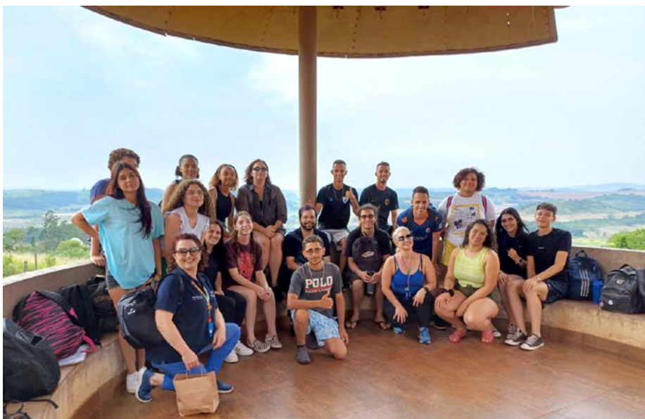
Sesc Londrina Centro