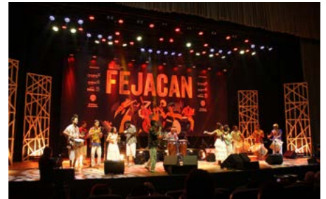
Mostra musical reuniu artistas de cinco estados do país