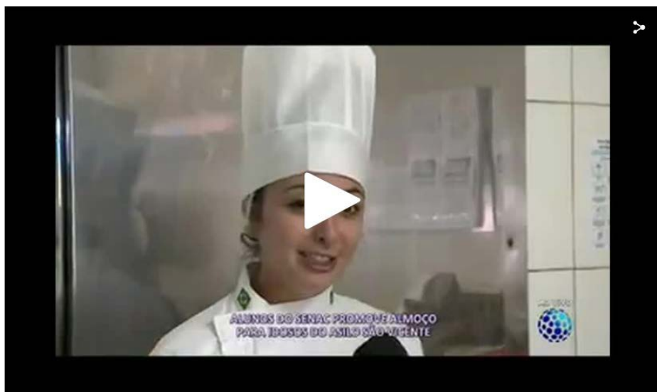
DESTAQUE ALUNOS DO SENAC PROMOVE PARA IDOSOS UM ALMOÇO NO ASILO SÃO VICENTE 08:57