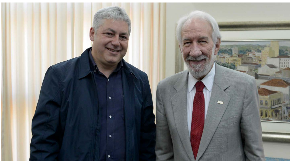
Da esquerda para a direita: o Secretário de Esporte e Turismo do Paraná, Douglas Fabrício e o presidente do Sistema Fecomércio Sesc Senac PR, Darci Piana

O Secretário de Esporte e Turismo do Paraná, Douglas Fabrício, visitou ontem (2) o presidente do Sistema Fecomércio Sesc Senac PR, Darci Piana. A visita teve como objetivo buscar apoio e divulgação para a realização de evento em Caiobá no mês de outubro.